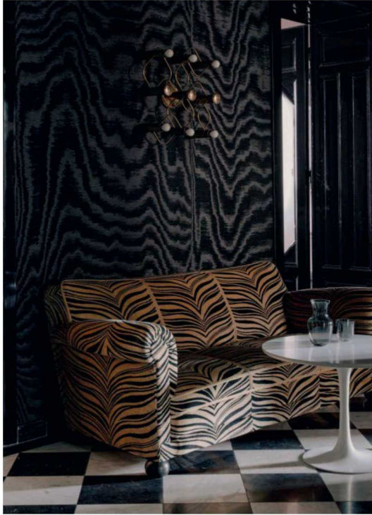
Das Sofa im Entree (li.) stammt vermutlich aus den 1930ern. Die Tapete dahinter kommt von Lelièvre Paris. Das Bad im Art-déco-Look (unten) ließen Sänger und Morali nahezu unverändert – als Hommage an den Vormieter und an den Meister der Schwarz-Weiß-Mode, Karl Lagerfeld.