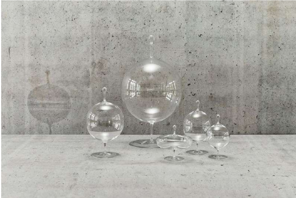
MATTER and SHAPE: Candy Dish di Oswald Haerdtl 1925, Lobmeyr

Prima edizione di MATTER and SHAPE: perché un'altra fiera e perché in questo momento? Cosa dobbiamo aspettarci?