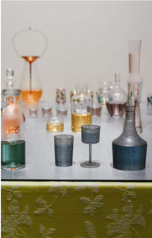
Le stand de J. & L. Lobmeyr scénographié par Formafantasma.