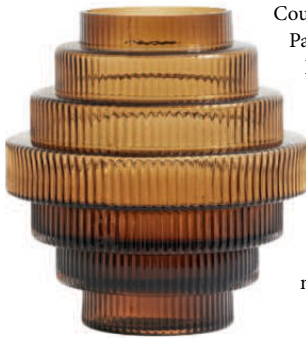
Bernstein Details wie die massive Glasvase »Rill« sind ideal, um dem Eigenheim ohne viel Aufwand Art-déco-Flair zu verleihen. nordal.com