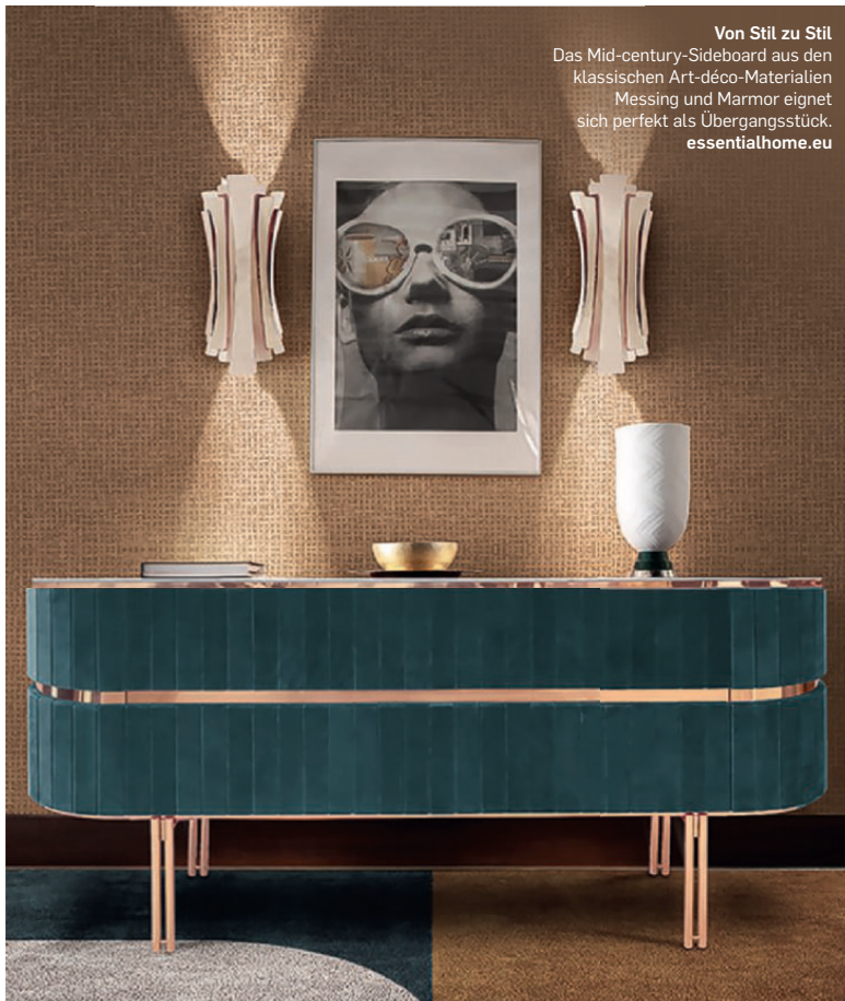
Von Stil zu Stil Das Mid-century-Sideboard aus den klassischen Art-déco-Materialien Messing und Marmor eignet sich perfekt als Übergangsstück. essentialhome.eu

Ob man nun den gesamten Wohnraum im Stil des Art déco umgestaltet oder nur auf einzelne Elemente und Signature Pieces zurückgreift: Die wagemutige Eleganz der Goldenen Zwanziger macht sich überall gut und ist (zurück)gekommen, um zu bleiben. <