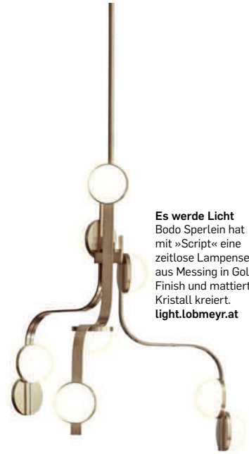
Es werde Licht Bodo Sperlein hat mit »Script« eine zeitlose Lampenserie aus Messing in Gold-Finish und mattiertem Kristall kreiert. light.lobmeyr.at

Typische Wandleuchten dieser Epoche etwa zeichnen sich durch gerade Linien und den Einsatz von Messing und Kristallglas aus – sie lassen sich in Kombination mit Paneelen und kräftigen Farben in Szene setzen. Eine andere Art Szene lässt sich mit Barwagen und Cocktail-Tools wie Shaker aus Chrom heraufbeschwören: Sie versetzen uns in die eleganten Bars der Roaring Twenties.