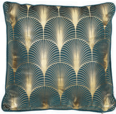
Samtweich Mit dem leuchtend smaragdgrünen Samtkissen »Whety« mit Keder und goldenem Art-déco-Print bettet man sich besonders glamourös. westwing.de

> Vorhänge – mit entsprechenden Prints, aus Samt und mit Goldornamenten, die Glamour in den Wohnraum holen.