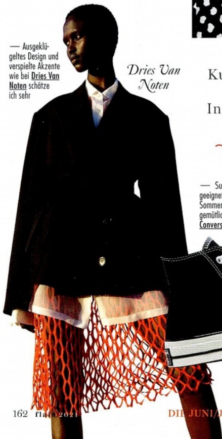
Dries Van Noten