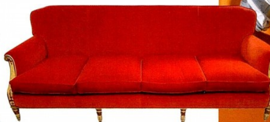
Friedrich Otto Schmidt

— Super geeignet für diesen Sommer: ein gemütliches Paar Converse