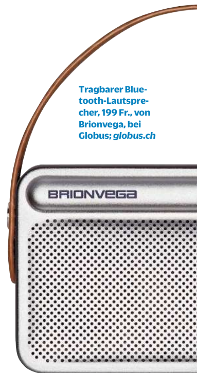
Tragbarer Bluetooth-Lautsprecher, 199 Fr., von Brionvega, bei Globus; globus.ch