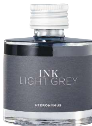
Schreibtinte «Light Grey», 50 ml, 48 Fr., von Hieronymus, Zürich; hieronymus-cp.com