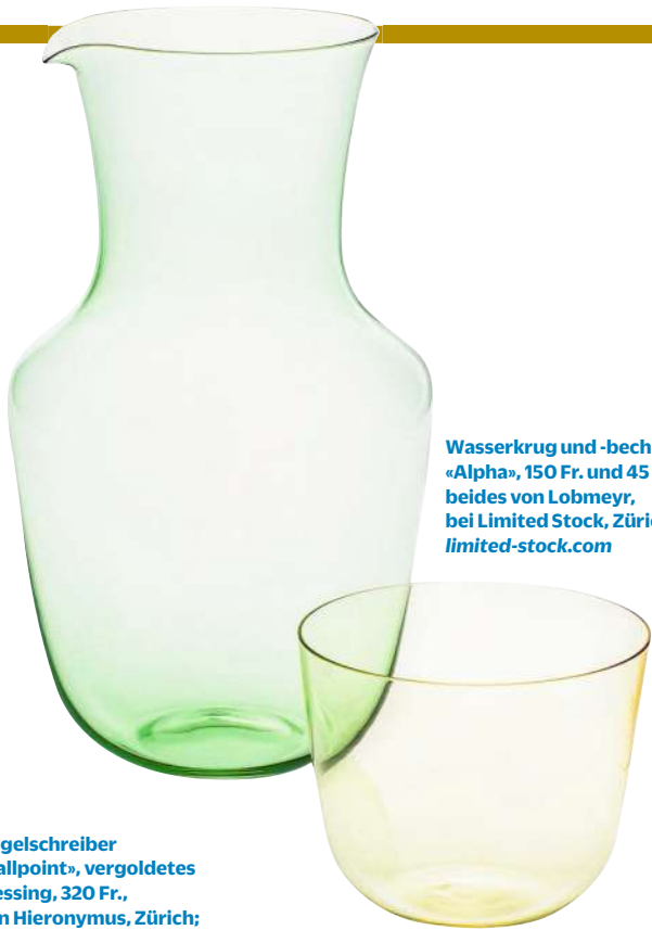
Wasserkrug und -becher «Alpha», 150 Fr. und 45 Fr., beides von Lobmeyr, bei Limited Stock, Zürich; limited-stock.com