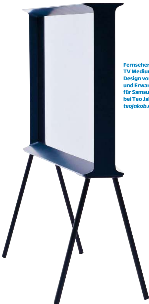
Fernseher «Serif TV Medium», 999 Fr., Design von Ronan und Erwan Bouroullec für Samsung, bei Teo Jakob; teojakob.ch