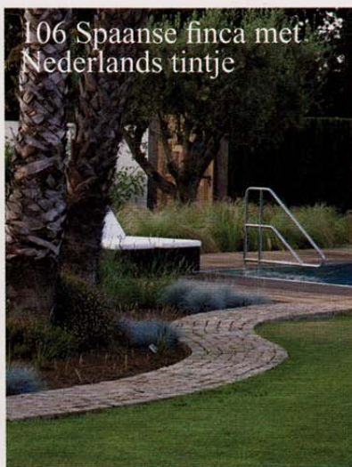
106 Spaanse finca met Nederlands tintje