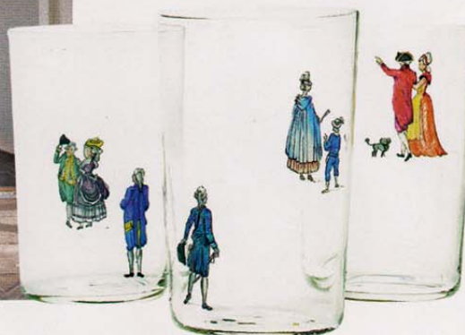
15 De nieuwste must-haves in Ouverture