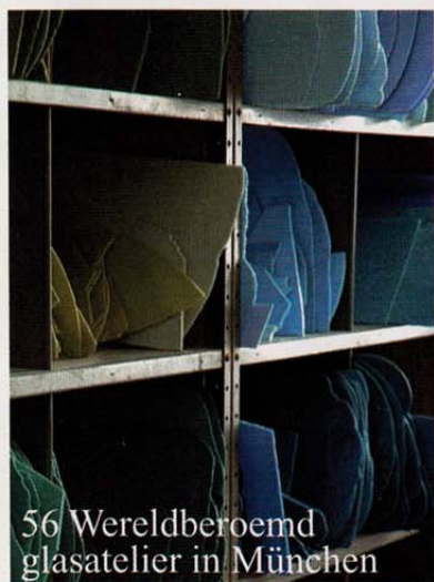
56 Wereldberoemd glasatelier in München