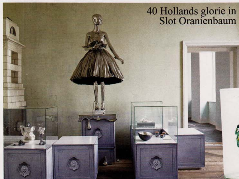
40 Hollands glorie in Slot Oranienbaum