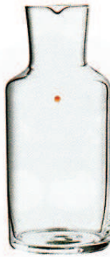
LOBMEYR, um 130 €