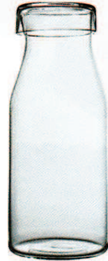
COVO, um 26 €