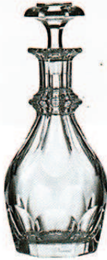
BACCARAT, um 800 €