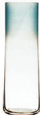
HAY, um 27 €