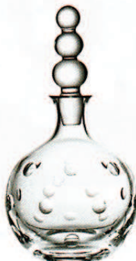
SAINT-LOUIS, um 495 €