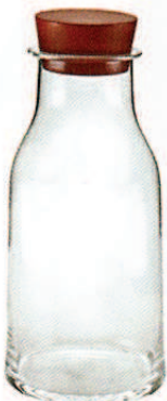
ALESSI, um 46 €