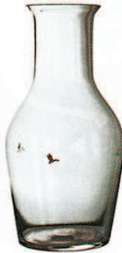
STILLSEGLER, um 88 €