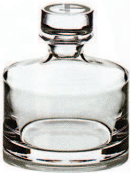
ARMANI CASA, um 180 €

SIE VEREDELN JEDE TAFEL UND GEBEN JEDER FLÜSSIGKEIT EINEN WÜRDIGEN RAHMEN: GLASKARAFFEN VON VERSPIELT BIS SCHLICHT. PROST!