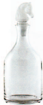
RALPH LAUREN HOME, um 915 €