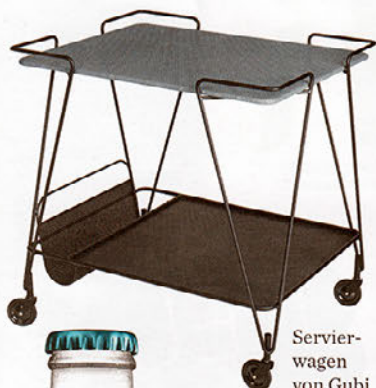
Servierwagen von Gubi, um 630 Euro