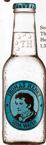
Soda von Thomas Henry, ab 1,50 Euro