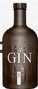
"Black Gin" von Gansloser Destillerie, 0,7l um 40 Euro