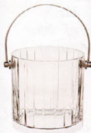
Eisbehälter von Baccarat, um 440 Euro