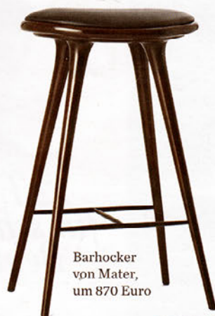
Barhocker von Mater, um 870 Euro