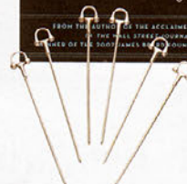
Cocktailspieße von Ralph Lauren Home, 6er-Set um 175 Euro