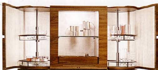
"Ino Bar" von Giorgetti, um 13 650 Euro

O b Gin Tonic, Whiskey Sour oder Cosmopolitan: In der neuen Barkultur spielen die bewährten Klassiker-Drinks wieder eine Hauptrolle. Und die Cocktailstunde wird entsprechend zelebriert: mit eleganten Hausbars, kostbaren Kristallgläsern, traditionellen Häppchen wie marinierten Oliven, liebevoll arrangiert – und viel Zeit. Eine stilvolle Alternative zu überteuerten Modedrinks, bunten Mixgetränken in Dosen und dem ewigen "To go"-Konsum.