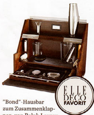
"Bond"-Hausbar zum Zusammenklappen, von Ralph Lauren Home, um 8000 Euro