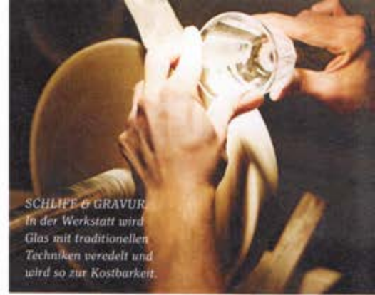
SCHLIFE & GRAVUR In der Werkstatt wird Glas mit traditionellen Techniken veredelt und wird so zur Kostbarkeit.