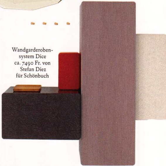
Wandgarderobensystem Dice ca. 7490 Fr. von Stefan Diez für Schönbuch