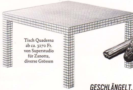
Tisch Quaderna ab ca. 3270 Fr. von Superstudio für Zanotta, diverse Grössen