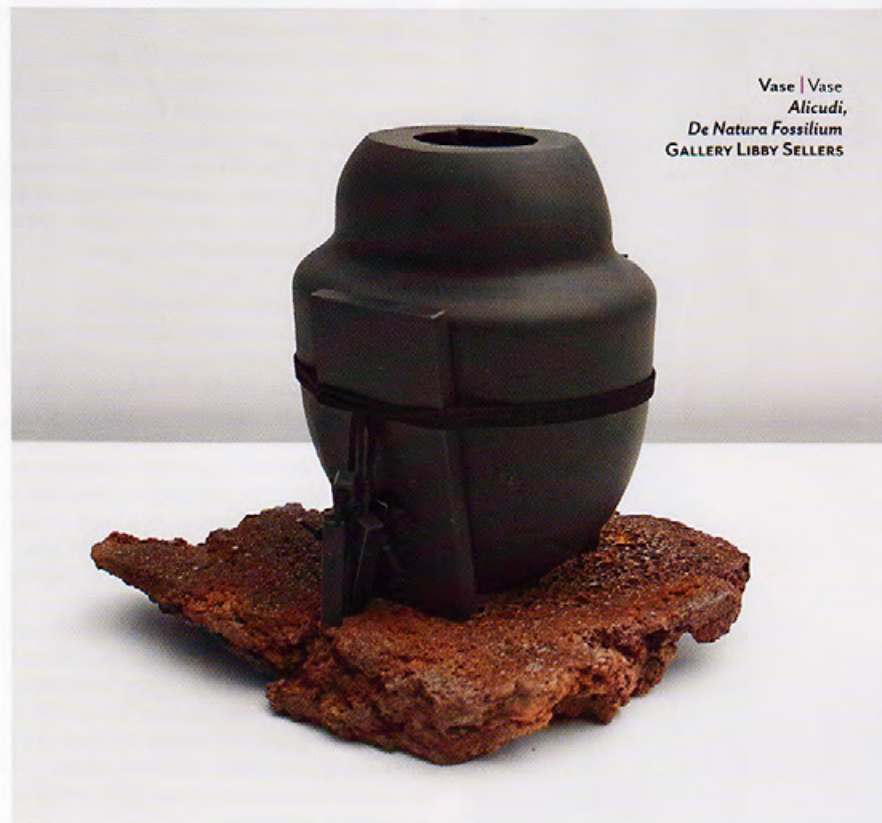
Vase | Vase Alicudi , De Natura Fossilium GALLERY LIBBY SELLERS