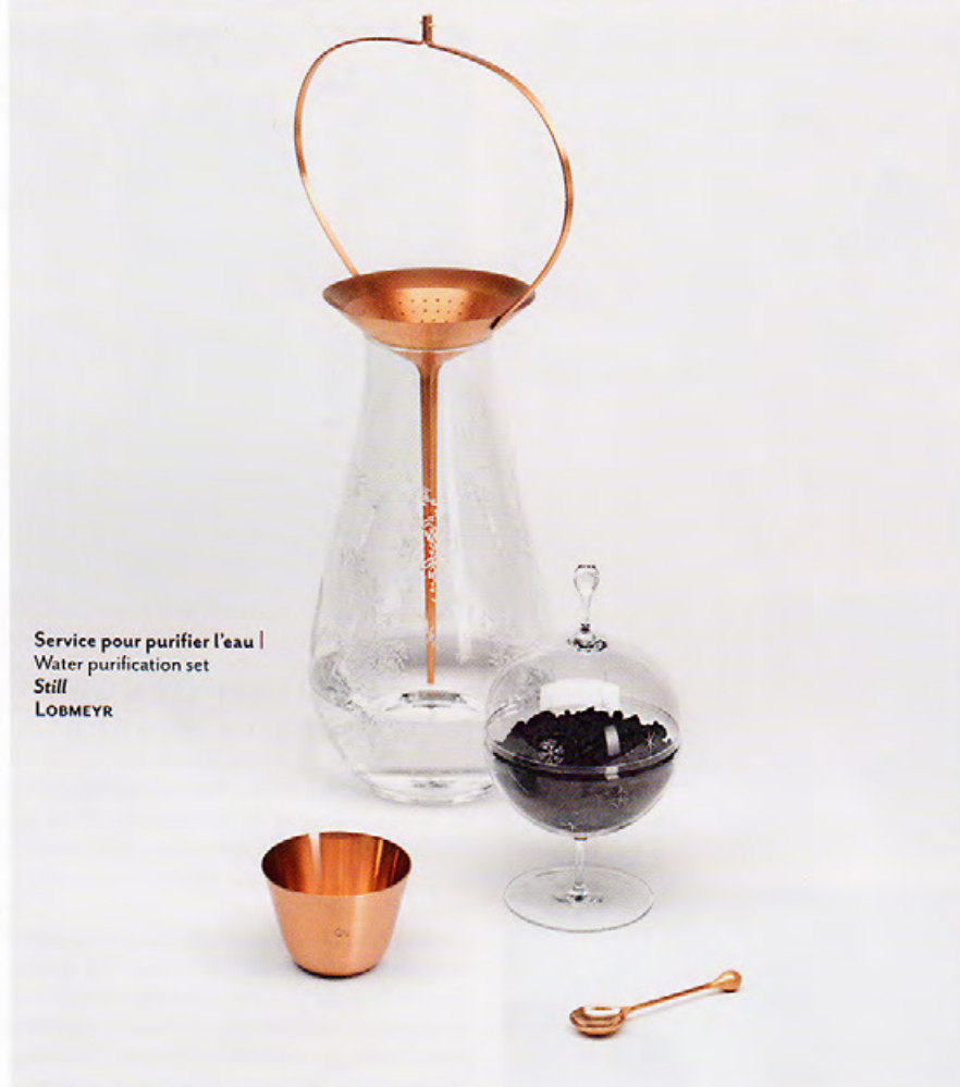
Service pour purifier l'eau | Water purification set Still LOBMEYR