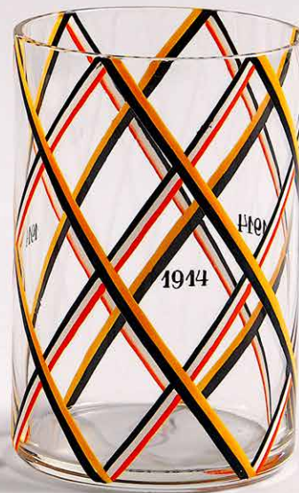
Josef Hoffmann, Bicchieri del periodo bellico, cristallo, smalto, manifattura Novy Bor (Haida) per la Wiener Werkstätte, 1916 ca.