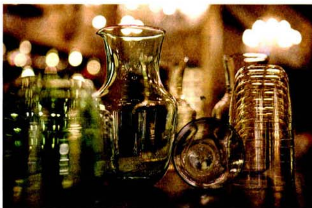
Hauchdünn: Lobmeyr-Trinkservice „Alpha“, 1952 entworfen und heute in vier zarten Farben sowie in Granatglas erhältlich.