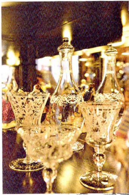
Barocke Pracht: Das Trinkservice Nr. 231 mit der verspielten Ornamentgravierung ist ein Lobmeyr-Klassiker.